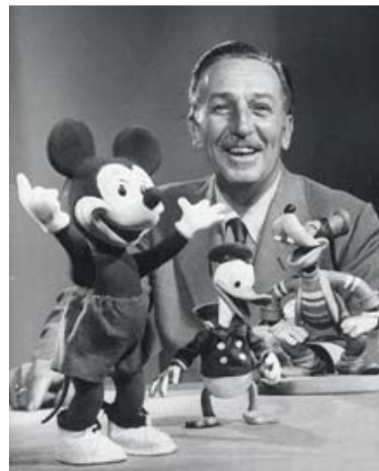
全球最大娱乐公司创始人沃尔特·迪斯尼

于企业领导者背离公司核心价值观。从优秀到卓越的企业一定有履行社会责任的信条,一定有超越利润至上的追求。雷曼前CEO迪克·富尔德(Dick Fuld)曾在2005年7月接受采访时宣称:“我希望公司的每个人都成为风险管理。风险管理是最重要的,如果只有我在关注,那么我们就有麻烦了。”全球最大娱乐公司创始人沃尔特·迪斯尼(Walt Disney)晚年遇到一个小男孩问他是否还画米老鼠和编故事,他摇摇头否定了。这个小男孩继续问他到底做什么时,沃尔特回答:“我把