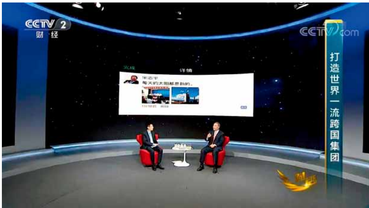
宋志平第三条朋友圈