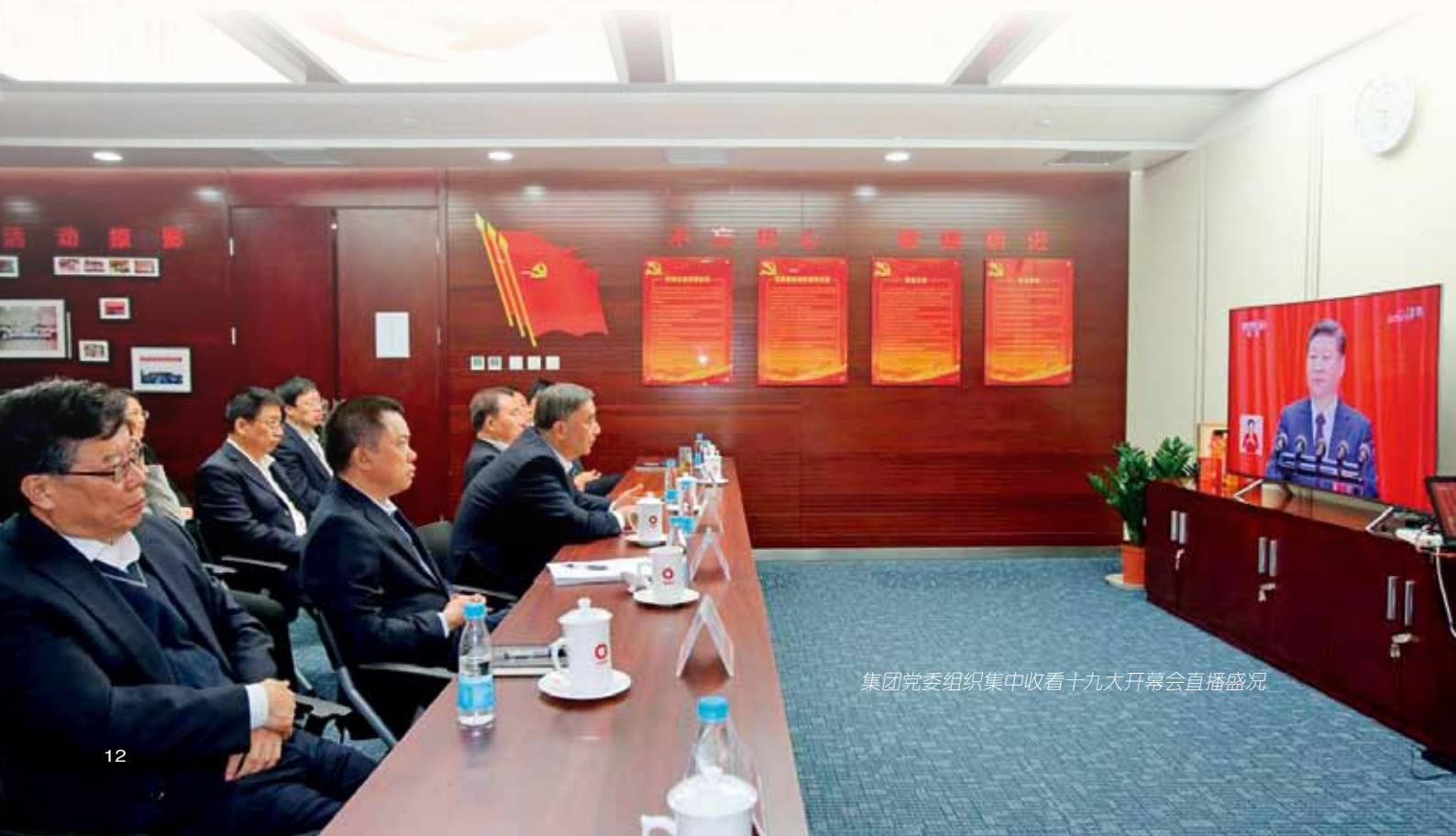
集团党委组织集中收看十九大开幕会直播盛况

党的十九大是在全面建成小康社会决胜阶段、中国特色社会主义进入新时代的关键时期召开的重要会议，具有划时代和里程碑意义。习近平总书记所作的十九大报告高举旗帜、引领复兴、气势磅礴、内涵丰富、鼓舞人心、催人奋进，是中国特色社会主义迈向新时代、开启新征程、续写新篇章的政治宣言和行动纲领，是我国国有企业改革发展进入新时代、展现新作为、实现新目标的科学指引和行动指南。中国建材集团深入学习贯彻党的十九大精神，用习近平新时代中国特色社会主义思想把握方向和统揽全局，未来五年要迈上“从大到伟大”新征程，目标是做强做优做大、打造具有全球竞争力的世界一流建材企业，主要途径是用改革创新增强企业的活力和动力、用整合优化提高企业的素质和效益、用“一带一路”拓展企业市场和成长空间。在十九大精神的指引下，中国建材集团要坚定信念，满怀信心，更加努力，奋发有为，引领中国建材事业全面进入新时代。