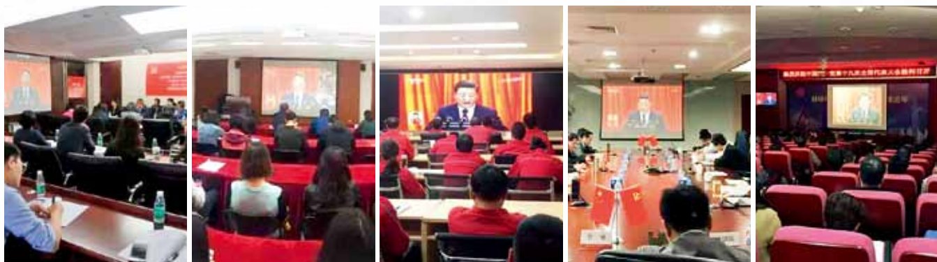
集团所属企业也纷纷组织观看十九大开幕会

在开幕会结束后，集团党委就深入学习贯彻十九大精神提出了三点具体要求：一是继续关注十九大会议进程，把学习十九大精神作为当前一项最重要的政治任务，迅速掀起学习热潮，并扎扎实实推进。二是集团各级领导干部要带头学习，率先垂范，深入思考，认真领会。三是结合实际，认真贯彻落实好十九大精神，特别是在加强党建、深化改革、创新发展等方面努力取得新的更大的成绩，再迈新台阶，再创新辉煌。