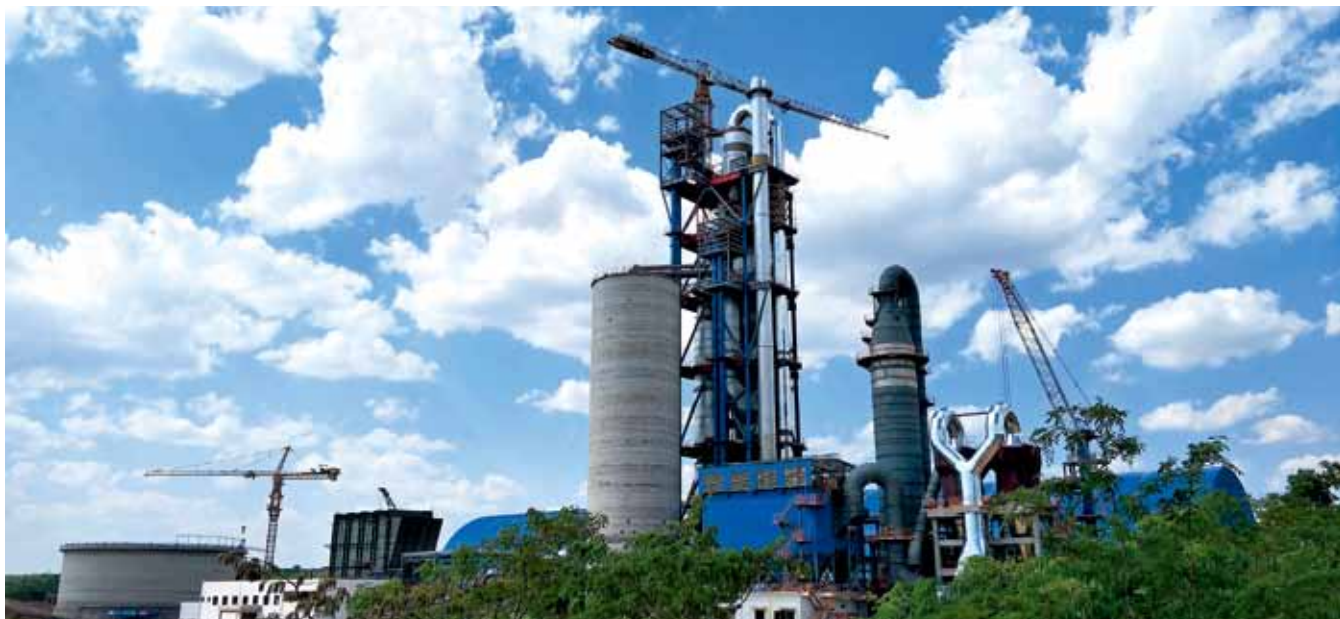
蓝天白云掩映下的园区

金秋十月，金桂飘香，金黄的稻谷伴随秋风在节拍中快乐起舞，金黄透红的枫叶在秋日的阳光里沉醉。十月的祖国大地是一个充满喜悦和收获的季节，是充满正能量的好日子。