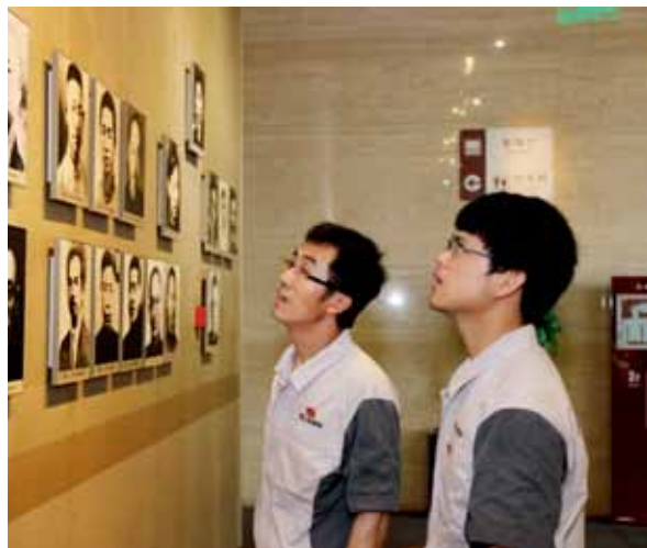
组织党员参观嘉兴南湖革命纪念馆

心行动，营造互帮互助的氛围。倡导企业内部建立“师傅带徒”培训模式，以中层干部及优秀技术管理人才帮带年轻员工，对员工学习情况进行跟踪了解，帮助年轻员工掌握硬本领，增长知识才干。深化清风廉洁工程，营造廉洁务实的工作环境。深入开展党风廉政宣传教育活动，组织党员员工学习廉洁规定，观看廉政宣传片和教育警示片，进一步增强廉洁自律意识。细化廉洁从业风险防控点，完善本单位内部廉洁从业机制，组织全体中高层领导干部、关键管理和技术岗位人员签订廉洁自律承诺书，加强对廉政风险点的排查、分析、评估和监督。公司党委班子带头廉洁自律，公开项目收支情况，主动接受群众监督，以党风廉政建设的实际成果影响和感染公司员工。