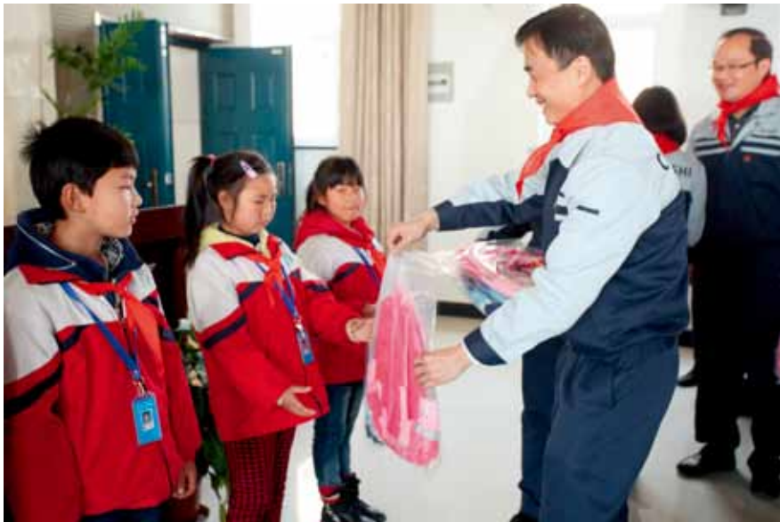
党员慰问困难新居民子女

品、最严谨的态度来做好质量改进，捍卫着公司的质量生命线，用自身形象潜移默化感召和影响身边人员。