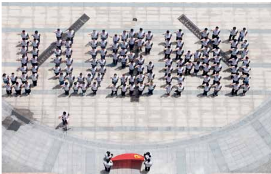
重温党章集体宣誓

三是注重强化担当,始终把落实责任作为职责所系抓紧不放。工作中,我们认真履行党建工作主体责任,始终担当敬业,忠实守责,落实全面从严治党要求,全力推动党建工作落实,确保抓实抓细抓到位。严格落实党建工作责任制,层层压实责任链条,按照“一岗双责”“一把手”负总责、分管领导各负其责的要求,把党建工作责任制贯穿到党务工作、生产建设、经营管理中,建立人人有责、人人负责、人人担责的责任体系,形成党建工作大家做的生动格局。坚持把执行党风廉政建设责任制作为党建工作的重点工作,借助党风廉政建设“两个责任”落实,强化问责意识,形成问责机制,保持问责常态。近年来,公司党委与上级党委、公司纪委与各党委委员和基层支部均层层签订《党风廉政建设责任书》,确保了“两个责任”在基层落地见效。探索建立党建工作考核评价体系,坚持把书记抓党建述职评议考核,作为党建工作的重要制度,通过完善工作格局、强化工作责