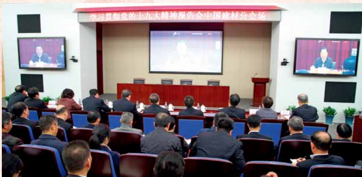
组织参加国资委学习贯彻党的十九大精神报告会