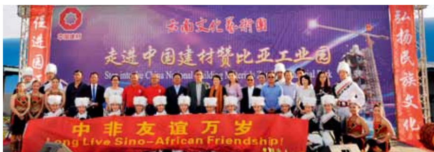
云南文化艺术团走进园区