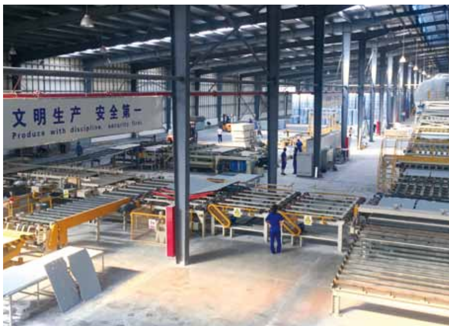
嘉兴石膏板生产线

在产品应用市场，北新建材把“品牌建设”作为企业发展战略引擎之一，瞄准地标工程项目、大客户和经销主渠道，全方位抢占应用市场制高点。北新建材大力投资石膏板应用技术开发服务，在业务前端，面向大客户推出重在前期一体化方案设计和材料设计咨询服务；在业务后端，推出系统配套、按需供应的客户整体服务。让“龙牌inside”和“北新partner”成为客户建筑品质的保障和名片，形成石膏板业务的核心竞争力，目前全国各地地标建筑和90%获得鲁班奖等国家建筑质量奖的重点工程项目都选用了北新建材的龙牌石膏板系统。