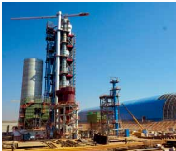
在赞比亚投资建设建材工业园

打造中国建材行业的世界名片。 习近平总书记提出，中国人民愿同各国人民一道，推动人类命运共同体建设，共同创造人类的美好未来。这体现了自信的中国胸怀天下的大格局。做企业也要有大格局。近年来，中国建材集团作为全球最大的建材制造商，响应国家号召，积极贯彻“走出去”战略，充分发挥自身技术、装备优势，先后在全球75个国家和地区承接了312个水泥项目、占全球新建水泥生产线的65%、连续9年保持全球水泥工程市场占有率第一，承接了60多个玻璃项目，运营了14家海外建材连锁超市、外包管理了全球30多家工厂，牢固树立起良好的企业形象和声誉。在此基础上，我们积极拓展市场空间，锁