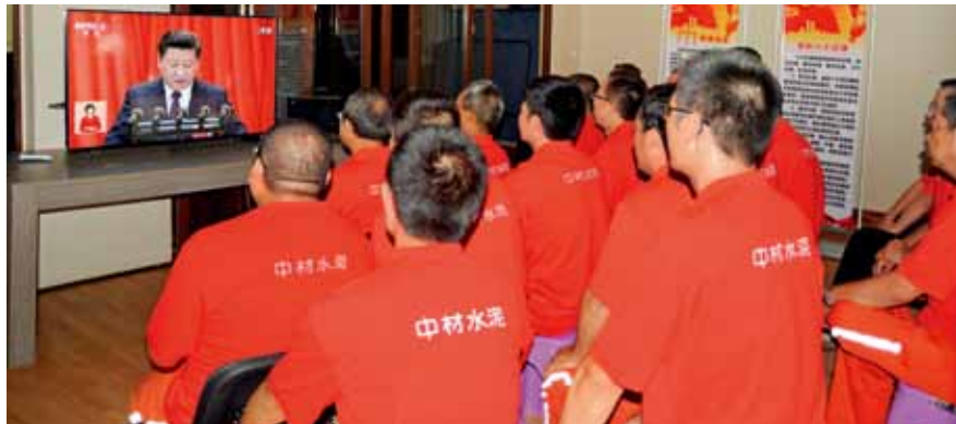
认真聆听习近平总书记作十九大报告

大家统一身着印有中国建材LOGO的T恤衫，12公里的山地路途，3个小时的步行时间，行程基本都是坎坷小道，边走边听着公司董事长张元慈对园区艰辛征地过程的回忆。赞比亚平均海拔1300米，艳阳高照，紫外线很强，行走在陡峭的山路上，大家相互搀扶，遇到树林阴凉处地席地而坐，补充给养。绝大多数员工是第一次参加徒步，工业园的广阔面积，沿途秀美的景致，园区开拓人曲折的故