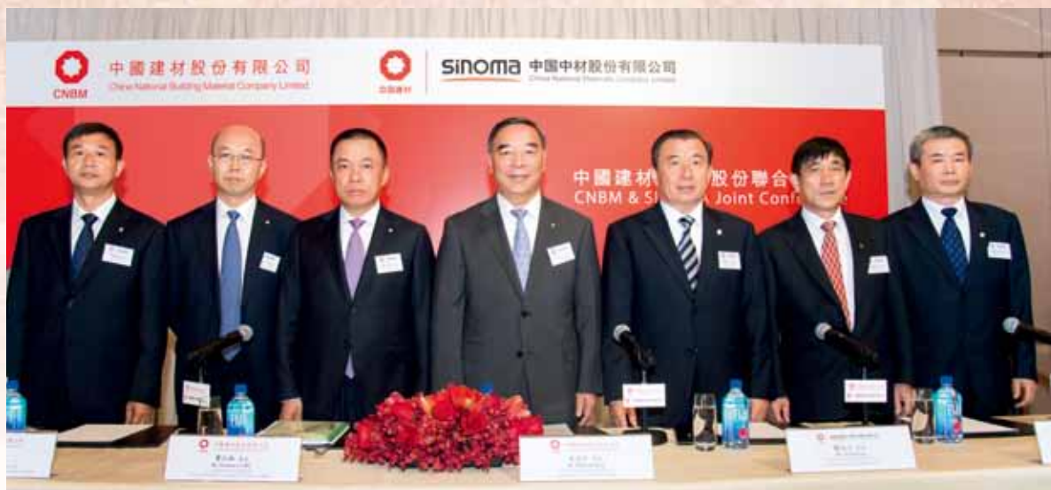
中国建材股份和中材股份联合发布合并公告

经济布局优化、结构调整、战略性重组，促进国有资产保值增值，推动国有资本做强做优做大。围绕上述任务，中国建材集团坚持整合优化的途径，进一步提高竞争力和综合实力，引领企业进入高质量发展的新阶段。