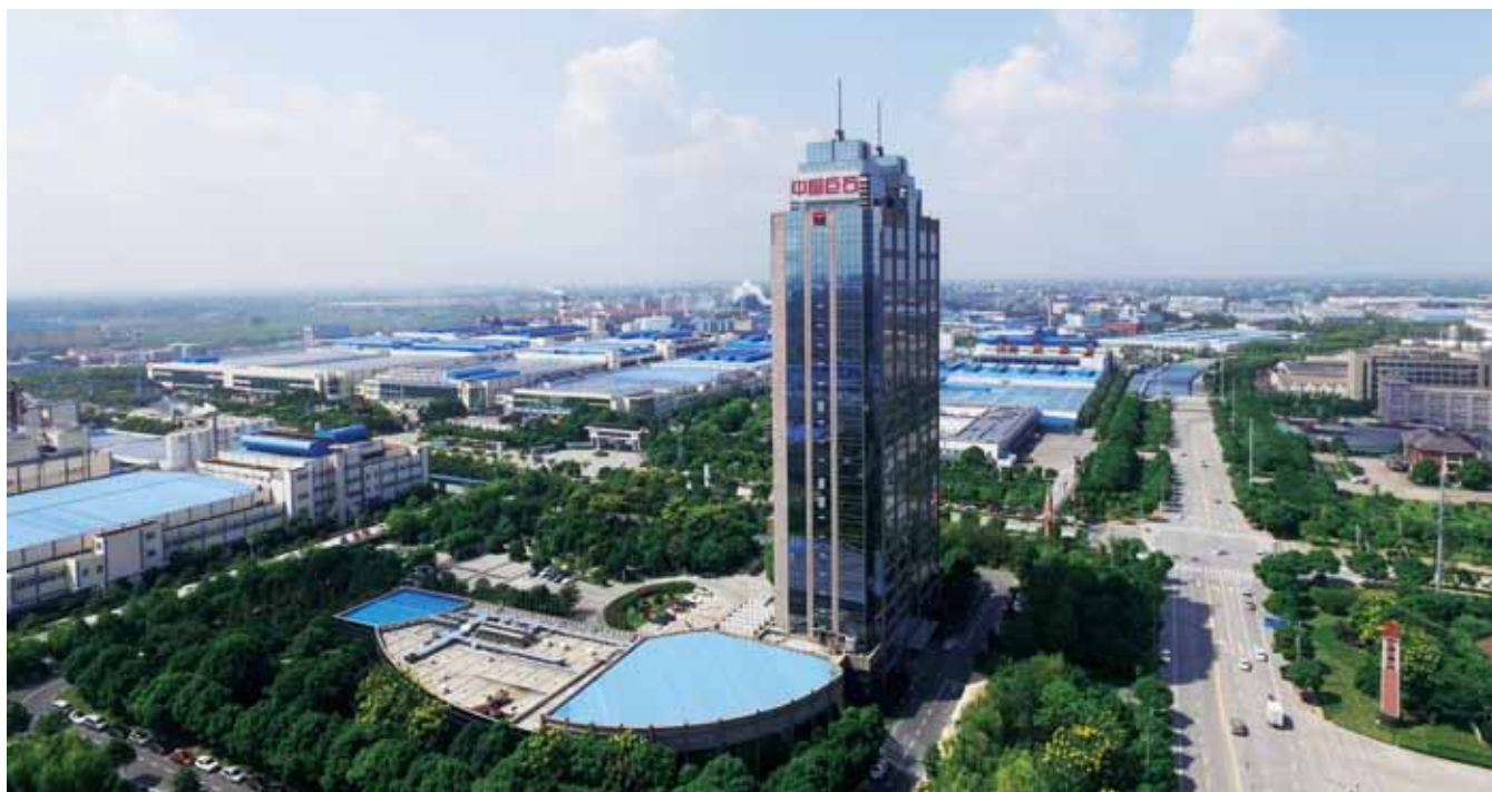
中国巨石总部——桐乡生产基地