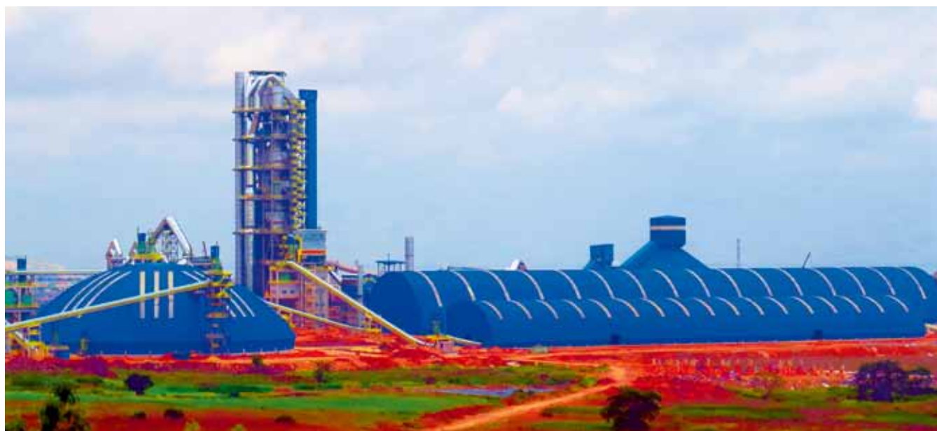
安哥拉项目全景照

五年来，一座座现代化水泥厂屹立在非洲大地，打造了中国建材行业的世界名片，中国企业品牌的影响力越来越大，受到所在国高层政要、各工商界、各使领馆的期许和支持，中国水泥影响力不断增强，在国际工程领域的话语权进一步提高，全球竞争力提高。