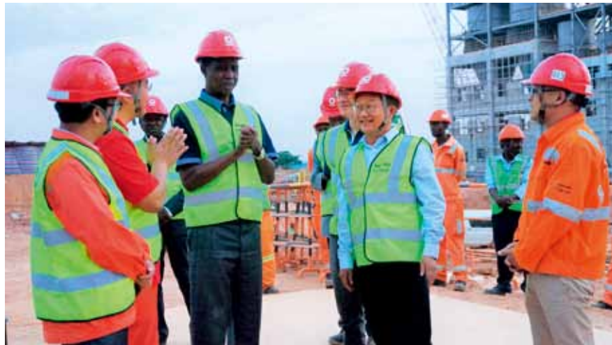
伦古总统视察现场

积极贯彻十九大报告中的新发展理念，增强活力，激发动力。开工建设短短一年多时间里，各子项形象进度突飞猛进，公司在赞比亚的属地化管理进程和效果也是渐入佳境，成为中国建材集团“六个一”国际发展目标中“10个迷你建材工业园”的先遣队和