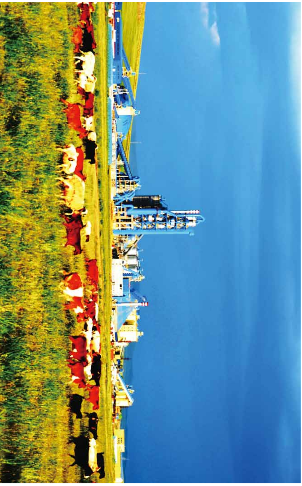
追求绿色发展 建设美丽中国（图为在蒙古国投资建设的“草原上的工厂”）