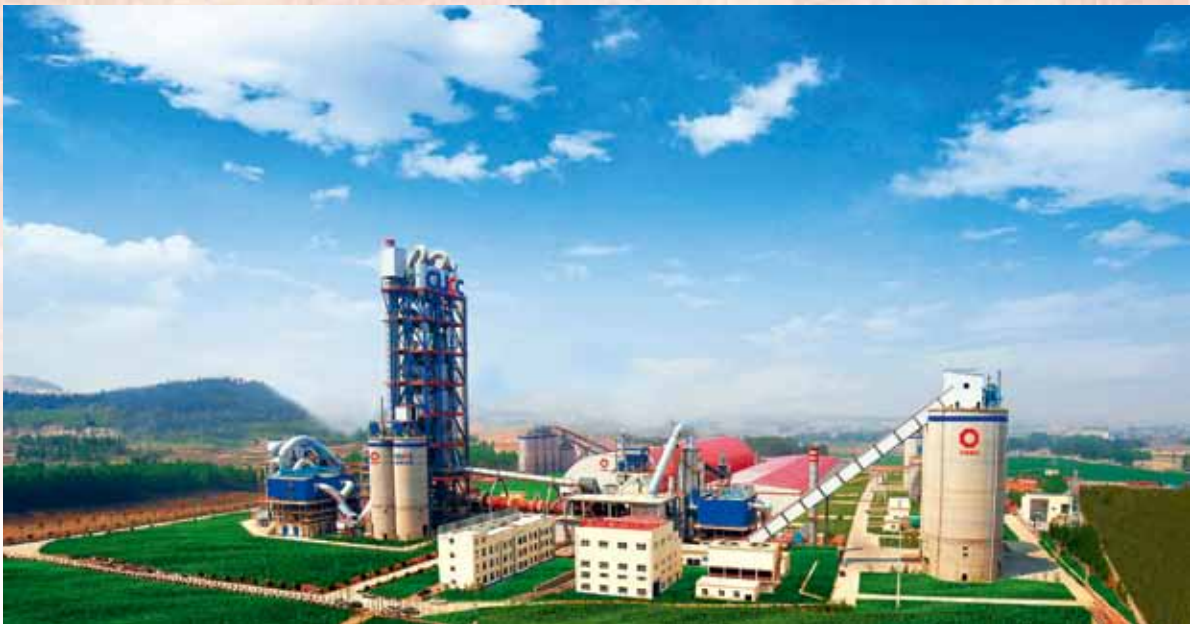
自主研发建造的现代化智能水泥工厂