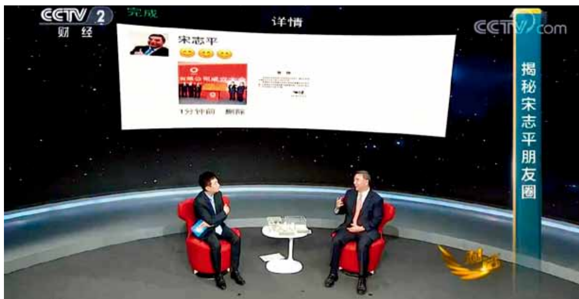
宋志平第二条朋友圈