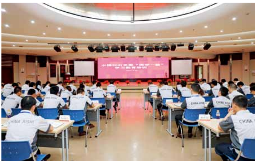
开展“两学一做”学习教育

任、加大考核力度,使党建工作考评由“软指标”变成“硬约束”。重点是做到“六个考评”:考评基层党组织设置是否健全,考评作用发挥是否明显,考评工作流程是否规范,考评支部建设是否加强,考评教育管理是否经常,考评党员群众是否信赖,把自查自纠“找问题”与督查整改“解决问题”有效结合,进一步督导各级把管党治党责任扛起来、做到位。实行常态化监督检查机制,坚持与其他工作一并督导检查,及时准确掌握党建工作开展情况、大项工作进展情况、党员教育管理情况、主体责任落实情况等内容,督查结果纳入年内考评结果。坚持构建全方位监督体系,充分发挥党组织监督、纪检监察监督、党员监督、职工民主监督、职能部门稽查等主体作用,加大监督力度,规范职权和职业行为。坚持班子相互监督与思想沟通相结合,公司领导班子成员之间每天进行早餐会和午餐会,把党建工作作为一项重要内容进行沟通和交流,分析前期工作成效,明确近期工作重点,形成党建共识、推动工作落实。